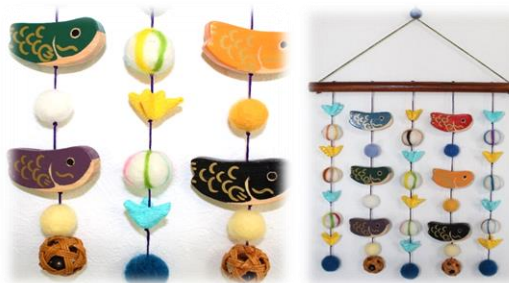
端午の節句の吊るし飾り。木工作业やつまみ細工、羊毛フェルトを組み合わせて、みんなで協力して一つの作品が完成します。