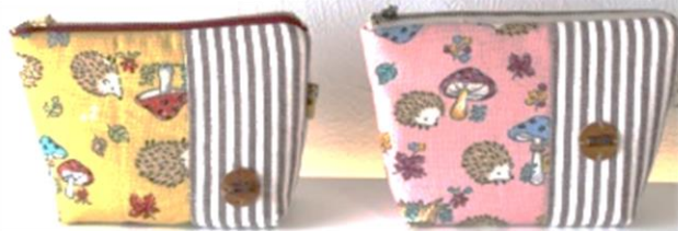
ハリネズミ柄のポーチ。布選びや色柄合わせにこだわってます。可愛い色柄で作るので、作る側のモチベーションも上がります。

皆さんの特性や体調など、適性に応じて取り組めるように配慮しながら作業をしていきます。 初めての作業は、スタッフが丁寧に説明します。