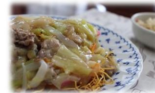
☆皿うどん、そら豆ご飯