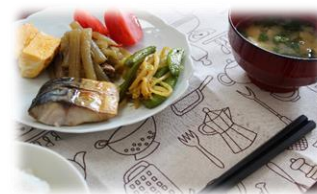
☆鯖の塩焼き、フキの酢漬け

栄養バランスの良い食事メニューを考え、毎日手作りで提供しております。 作業所に来て食事するというだけでも、社会復帰の大きな一歩目だと考えております。