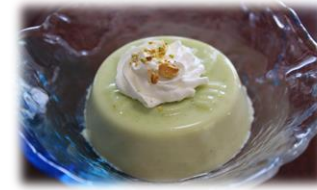
☆そら豆のムース (月に一度のスイーツ大会)