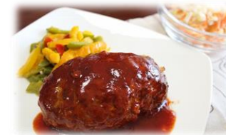
☆ハンバーグ、大根と人参のなます