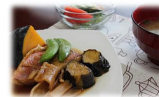
☆赤魚の煮付け、かぼちゃの煮物