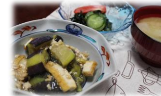
☆茄子と厚揚げのそぼろ煮、海藻サラダ