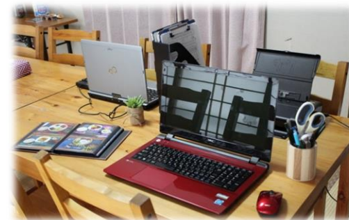
日々の昼食写真のUP、ブログの更新、おたより作成、ホームページの簡単な管理業務等行います。