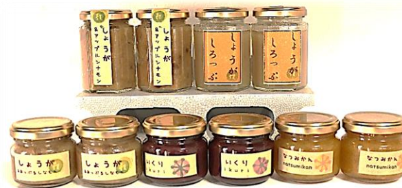
ジャム各種。五島産のいくり、しょうが、甘夏等を仕入れて、瓶詰めまで手作業で行います。しょうが&アップルジンジャーが人気。